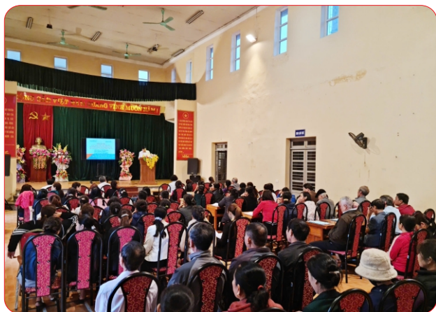
Liên minh HTX phối hợp với Hội làm vườn tuyên truyền phát triển kinh tế tập thể tại huyện Định Hóa (trước sáp nhập)

Sau 4 năm triển khai thực hiện Chương trình phối hợp số 324/CTPH-LMHTX-CCQ ngày 12/8/2022 giữa Liên minh HTX tỉnh và 26 sở, ngành, đoàn thể và các đơn vị về đẩy mạnh phát triển kinh tế tập thể tỉnh Thái Nguyên giai đoạn 2022 - 2025, khu vực kinh tế tập thể (KTTT), hợp tác xã (HTX) tỉnh Thái Nguyên thời gian qua đã có bước phát triển cả về số lượng và chất lượng.