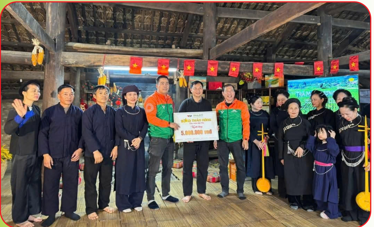
Hợp tác xã Tài Hoan (xã Côn Minh) nhận giải thưởng Sao Thần nông năm 2025