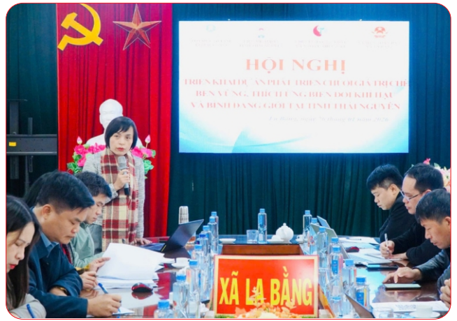
Đại diện tổ chức Stichting Oxfam Novib phát biểu tại xã La Bằng

Một điểm nhấn đáng chú ý của dự án là việc hỗ trợ các HTX duy trì mô hình sản xuất bền vững thông qua mở rộng tiếp cận nguồn vốn tín dụng. Dự kiến sẽ có khoảng 100 thành viên HTX được tiếp cận các nguồn vốn vay để đầu tư, cải tiến và áp dụng các giải pháp sản xuất bền vững. Thông qua việc đánh giá nhu cầu vốn, xây dựng các sản phẩm tín dụng xanh phù hợp và hướng dẫn quy trình vay vốn, dự án góp phần tháo gỡ một trong những “nút thắt” lớn nhất hiện nay đối với khu vực kinh tế tập thể, đó là khó khăn trong