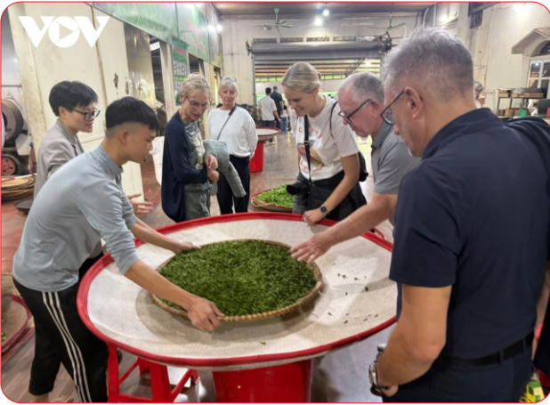
Du khách trải nghiệm tại các HTX sản xuất, chế biến chè

T hiếu vốn từng là rào cản lớn khiến nhiều hợp tác xã khó mở rộng sản xuất, đổi mới công nghệ. Tại Thái Nguyên, nguồn vốn từ Quỹ Hỗ trợ phát triển hợp tác xã đang dần trở thành điểm tựa quan trọng, giúp các đơn vị tháo gỡ khó khăn, nâng cao hiệu quả hoạt động, tạo thêm việc làm, thu nhập cho người lao động.