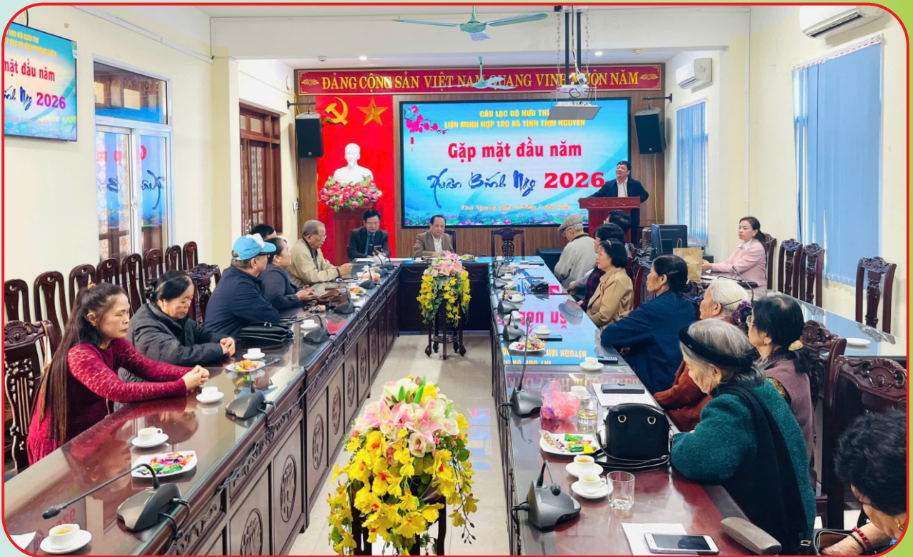
Câu lạc bộ hưu trí Liên minh HTX tỉnh Thái Nguyên gặp mặt đầu xuân năm 2026