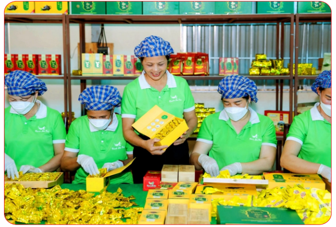
HTX chè La Bằng, một trong những đơn vị điển hình tiên tiến của tỉnh Thái Nguyên

Giai đoạn 2020–2025 chứng kiến sự chuyển biến rõ rệt của khu vực KTTT, HTX trên địa bàn tỉnh. Các HTX từng bước được củng cố về tổ chức, đổi mới phương thức hoạt động và nâng cao năng lực thích ứng với cơ chế thị trường.