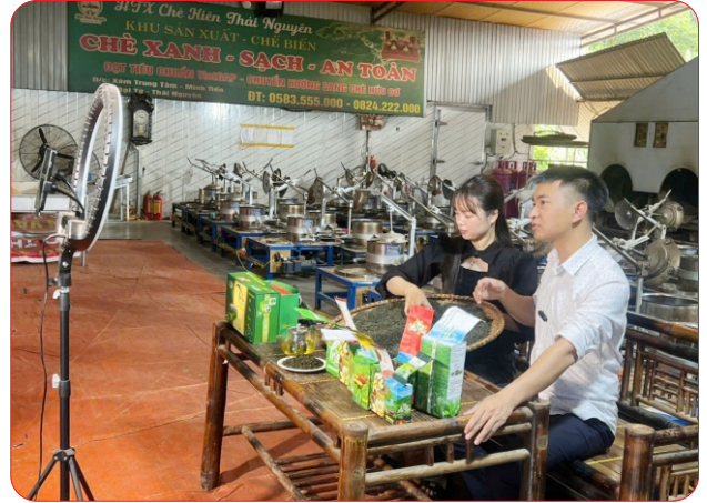
HTX Trà then (xã Đức Lương) đẩy mạnh bán hàng qua livestream ngay tại cơ sở sản xuất, quảng bá sản phẩm và mở rộng thị trường tiêu thụ

Kết quả từ năm 2020 đến nay, đã tổ chức cho trên 500 lượt HTX tham gia quảng bá, giới thiệu sản phẩm tại các hội chợ, triển lãm trong nước do Liên minh HTX Việt Nam, các tỉnh, thành phố và các sở, ban, ngành của tỉnh Thái Nguyên tổ chức như: Festival trái cây và sản phẩm OCOP Việt Nam năm 2022 tại tỉnh Sơn La, hội chợ OCOP Quảng Ninh, Festival nông sản và sản phẩm OCOP gắn với du lịch Hà Nội; Hội chợ triển lãm “Mỗi xã, phường một sản phẩm – Thái Nguyên, Hội chợ xúc tiến thương mại cho các HTX Coop-Expo hàng năm do Liên minh HTX Việt Nam tổ chức; các chuỗi hoạt động Người Việt dùng hàng Việt do Sở Công Thương tỉnh tổ chức.... Đặc biệt, hàng năm Liên minh HTX tỉnh tổ chức thường niên “Tuần lễ trưng bày sản