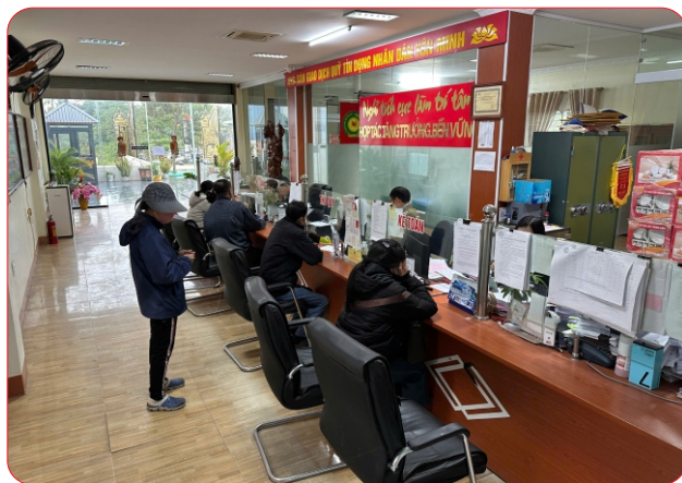
Khách hàng đến giao dịch vay vốn tại Quỹ

Hoạt động tín dụng của Quỹ được định hướng tập trung vào những lĩnh vực gắn trực tiếp với sinh kế của người dân. Riêng năm 2025, Quỹ đã hỗ trợ gần 1.000 lượt vay với doanh số hàng trăm