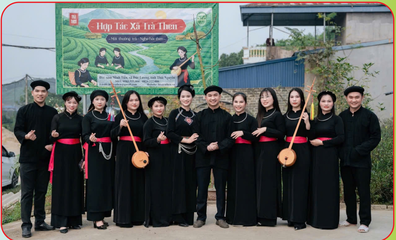
Ra mắt HTX Trà Then và Câu lạc bộ hát Then xã Đức Lương