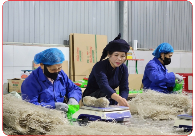
Sản xuất miến tại HTX Tài Hoan

Được thành lập năm 2018, Hợp tác xã Tài Hoan từng đối mặt với nhiều khó khăn như thiếu vùng nguyên liệu ổn định, sản xuất thủ công, chưa xây dựng được thương hiệu. Tuy nhiên, với định hướng phát triển sản phẩm sạch, an toàn, đơn vị đã từng bước chuẩn hóa quy trình, liên kết với nông dân để chủ động nguồn nguyên liệu. Từ sản phẩm OCOP 4 sao năm 2018, đến năm