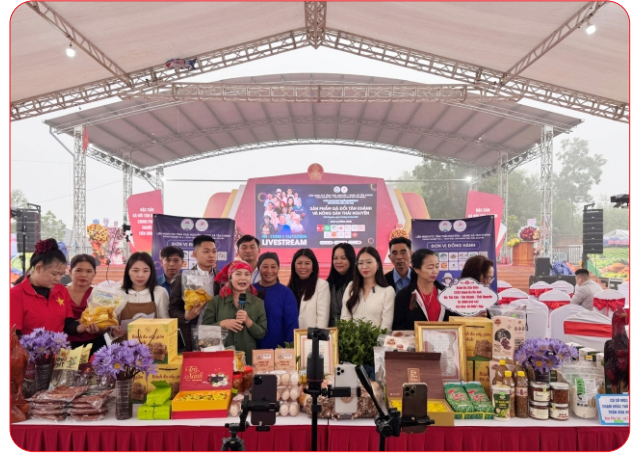
Các HTX livestream sản phẩm gà đồi Tân Khánh và các sản phẩm tiêu biểu của tỉnh Thái Nguyên

Nếu như chuyển đổi số giúp HTX Trà Then mở rộng thị trường thì tại HTX Nông sản Ong