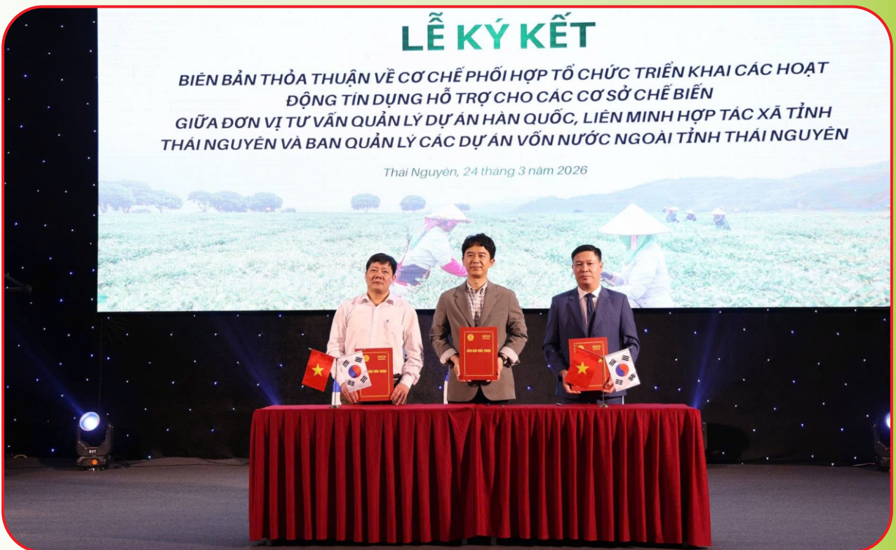
Ký kết biên bản thỏa thuận phối hợp tổ chức triển khai các hoạt động tín dụng hỗ trợ các cơ sở chế biến giữa đơn vị tư vấn quản lý các dự án Hàn Quốc, Liên minh HTX tỉnh Thái Nguyên và Ban quản lý các dự án vốn nước ngoài