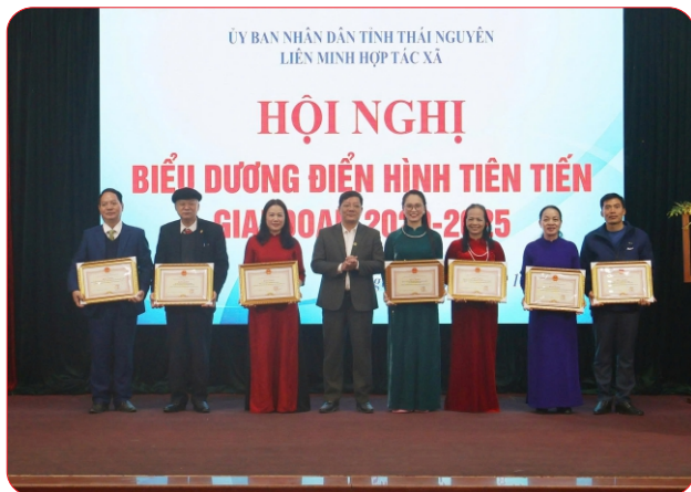
Các tập thể, cá nhân được nhận Bằng khen của Liên minh HTX Việt Nam đã có thành tích xuất sắc trong phát triển kinh tế tập thể

T rong giai đoạn 2020–2025, dưới sự quan tâm lãnh đạo, chỉ đạo sâu sát của Tỉnh ủy, HĐND, UBND tỉnh, Liên minh Hợp tác xã (HTX) Việt Nam và sự phối hợp của các sở, ban, ngành và cấp ủy, chính quyền các cấp, sự nỗ lực của các đơn vị thành viên, khu vực kinh tế tập thể (KTTT) và hoạt động của Liên minh HTX tỉnh Thái Nguyên đã đạt được nhiều kết quả quan trọng, khẳng định vai trò ngày càng rõ nét trong phát triển kinh tế - xã hội của địa phương.