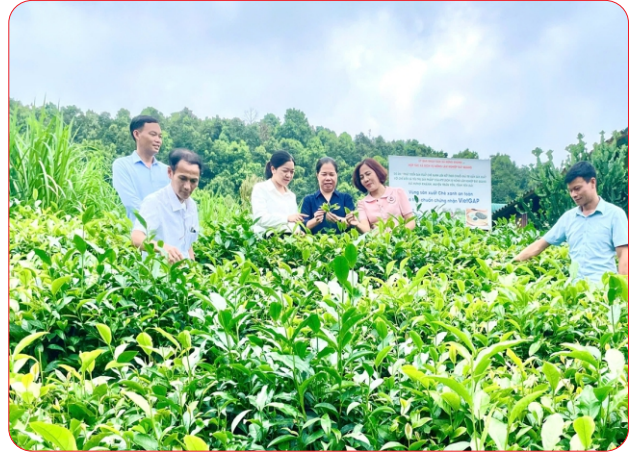
Sở hữu trí tuệ giúp sản phẩm HTX định vị thương hiệu tốt hơn trên thị trường, nâng cao uy tín, sức cạnh tranh.

HTX Chè Khe Năm, xã Hưng Khánh là một minh chứng tiêu biểu cho hiệu quả của việc gắn sản xuất nông nghiệp với bảo hộ sở hữu trí tuệ.