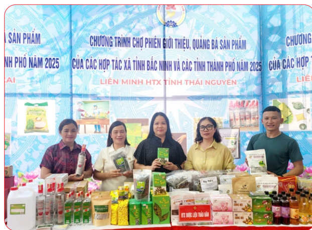
Các HTX tỉnh Thái Nguyên tham dự Phiên chợ giới thiệu sản phẩm tại tỉnh Bắc Ninh

Thường xuyên duy trì đưa tin và kết nối tiêu thụ sản phẩm/dịch vụ của HTX trên các website, fanpage... đồng thời hướng dẫn để các HTX từng bước áp dụng thực hiện việc XTTM trên môi trường số, ứng dụng trí tuệ nhân tạo (AI) trong hoạt động sản xuất kinh doanh thông qua các lớp tập huấn, bồi dưỡng. Hỗ trợ tổ chức trên 50 chương trình, phiên chợ livestream xúc tiến tiêu thụ sản phẩm nông sản, đặc sản các địa phương