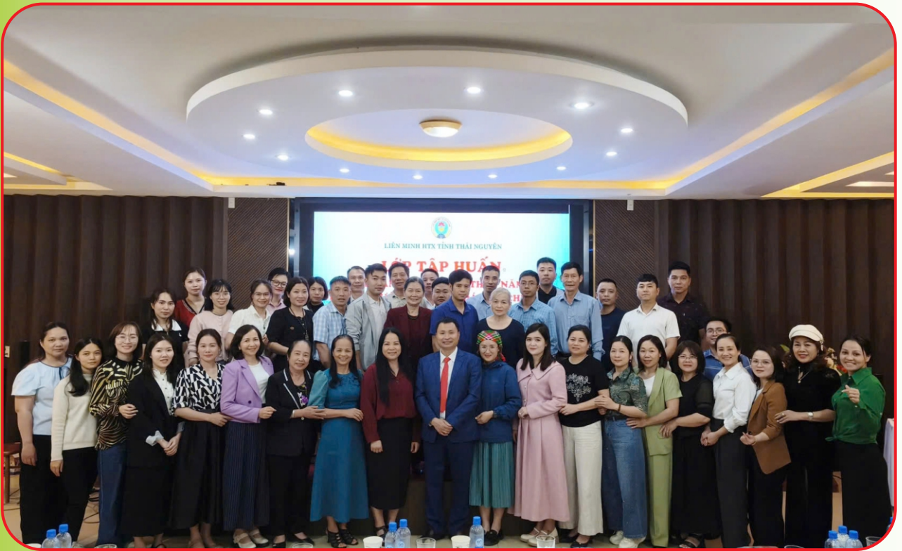
Học viên tham dự lớp tập huấn hướng dẫn quyết toán thuế năm 2025 và giải đáp vướng mắc về hoá đơn chứng từ