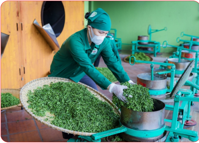
Sao sấy chè tại HTX chè Hảo Đạt

nghe vào sản xuất và chế biến. Sản phẩm của HTX hiện đã đạt OCOP 5 sao cấp quốc gia, minh chứng rõ ràng cho chất lượng và uy tín của chè Tân Cương. "Chúng tôi nhận được sự quan tâm của Sở Công Thương về hỗ trợ công nghệ, giúp nâng cao năng suất, giảm sức lao động, đồng thời tăng giá trị sản phẩm. Nhờ đó, sản phẩm của HTX không chỉ tiêu thụ trong nước mà còn hướng tới thị trường quốc tế" - bà Hảo chia sẻ.