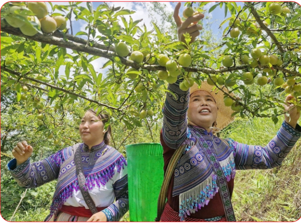
Việc tham gia HTX giúp nông dân có nội lực tốt hơn để phát triển sản phẩm, tiếp cận sở hữu trí tuệ.

thiết thực mà sở hữu trí tuệ mang lại cho người sản xuất.