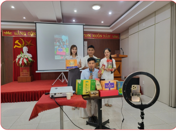
Các HTX thực hành Livestream sản phẩm tại lớp tập huấn do Liên minh HTX tỉnh tổ chức

trước yêu cầu đổi mới mạnh mẽ. Giai đoạn 2020 –2025, xác định chuyển đổi số là giải pháp đột phá, Liên minh HTX tỉnh đã triển khai nhiều chương trình hỗ trợ thiết thực. Hơn 40 lớp tập huấn với gần 2.000 lượt học viên được tổ chức, tập trung vào kỹ năng bán hàng online, marketing số, xây dựng thương hiệu, livestream, ứng dụng trí tuệ nhân tạo. Khoảng 400 gian hàng của HTX đã có mặt trên các nền tảng như TikTok, Postmart, Voso, Alibaba..., góp phần tiêu thụ hàng trăm tấn nông sản. Hơn 100 HTX được hỗ trợ xây dựng website, gần 300 HTX ứng dụng phần mềm quản lý bán hàng và kho. Mỗi năm, hàng chục nghìn tem truy xuất nguồn gốc được triển khai.