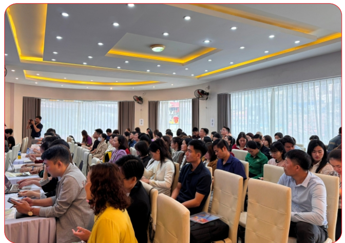
Học viên tham dự lớp tập huấn

Đây cũng là dịp để các HTX tăng cường trao đổi kinh nghiệm, chia sẻ những khó khăn, vướng mắc trong thực tiễn, từ đó nâng cao hiệu quả hoạt động sản xuất, kinh doanh và chủ động thích ứng với yêu cầu chuyển đổi số trong giai đoạn hiện nay.