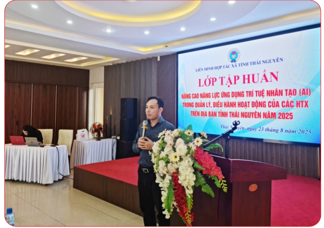
Tập huấn nâng cao năng lực ứng dụng trí tuệ nhân tạo (AI) trong quản lý, điều hành hoạt động của các HTX

Thực hiện mô hình đưa cán bộ trẻ tốt nghiệp cao đẳng, đại học, trên đại học về làm việc tại HTX theo nội dung Đề án phát triển kinh tế tập thể tỉnh Thái Nguyên giai đoạn 2021 – 2025, Liên minh HTX tỉnh đã thực hiện hỗ trợ cho 149 HTX để chi trả tiền lương cho 149 lao động trẻ về làm việc tại HTX đã được ký kết hợp đồng lao động và cam kết làm việc lâu dài cho HTX với mức hỗ